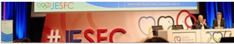
Remise de Prix Santélyls 2023